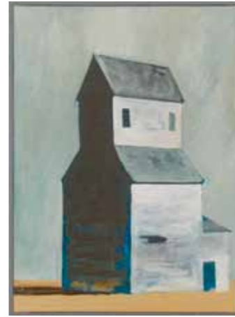
Silo | Öl auf Leinwand | 80 x 60 cm | 2011

Wenn Markus Lange sich seiner Seheindrücke während der Fahrt durch das ländliche Amerika erinnernd, Kornspeicher und Getreidesilos oder auch Wassertürme malt, erinnert er darüber hinaus mit seinen Gemälden an den Lauf der Zeit. Ständen die funktionalen in Modulbauweise errichteten Agrarbauten doch für die Hochzeit landwirtschaftlicher Prosperität. Als im Rahmen der industriellen Revolution im 19. Jahrhundert die Anbaumöglichkeiten von Getreide weltweit in die Höhe schnellten, wuchs auch der Bedarf an neuen und vor allem großen Lagerstätten. Vor diesem Hintergrund wurden unzählige Kornspeicher und Getreidesilos errichtet. Wie Festungen erheben sich diese Architekturen bis heute in der meist flachen Landschaft der Anbaugelände.