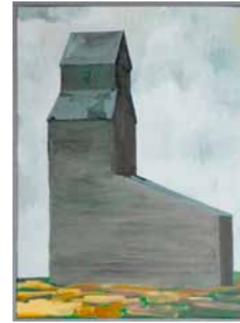
Prairie Grain | Öl auf Leinwand | 80 x 60 cm | 2011

Aus Holz oder Beton errichtet, sind sie zugleich Wahrzeichen des industriellen Booms und Niedergangs. Lange interessiert sich in MORNING DEW vorrangig für diesen Niedergang, den baulichen Verfall, der immer auch den Weggang der dort lebenden und arbeitenden Menschen thematisiert. Indem er den Bauwerken dieser vergangenen Epoche einen zentralen Platz in seinen Gemälden einräumt, quasi ein zeitgenössisches Porträt von ihnen schafft, dokumentiert und dokumentiert er diese.