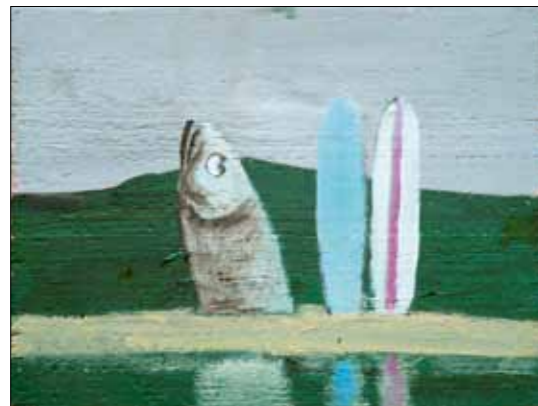
Oben: Why Not | Öl auf Holz | 20 x 26 cm | 2011 Rechts: Der Fahrer | Öl auf Holz | 33 x 29 cm | 2010