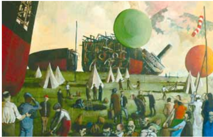
Die Neuerer | Öl auf LW | 100 x 150 cm | 2009